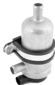
PH med originalfäste