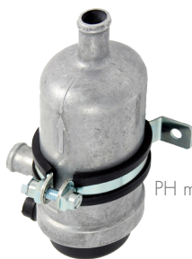
PH med fäste PH Pro

Samtliga PH har ett 20 mm. anslutningsrör. Värmaren levereras antingen som en komplett sats med värmare, originalfäste och kablar alternativt enbart värmare med originalfäste. Fäste PH Pro köps separat.