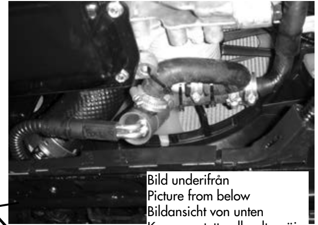
Bild underifrån Picture from below Bildansicht von unten Kuva on otettu alhaalta päin